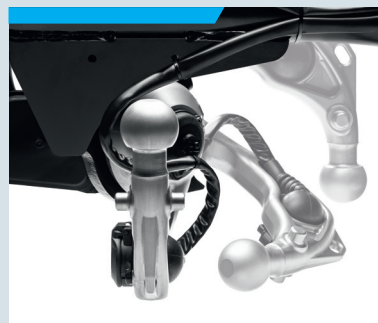
Volledig elektrisch wegkantelbare trekhaken